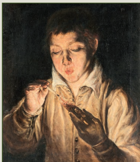
El Greco (Candia, 1541 – Toledo, 1614) El soplon , 1571-72, olio su tela

Una selezione di dipinti e oggetti che disegnano in facile acchito il rapporto con i personaggi per cui furono realizzati e le vicende che avevano condotto alla realizzazione della raccolta di famiglia che , tra Cinquecento e Settecento, fu una delle più importanti d'Europa .