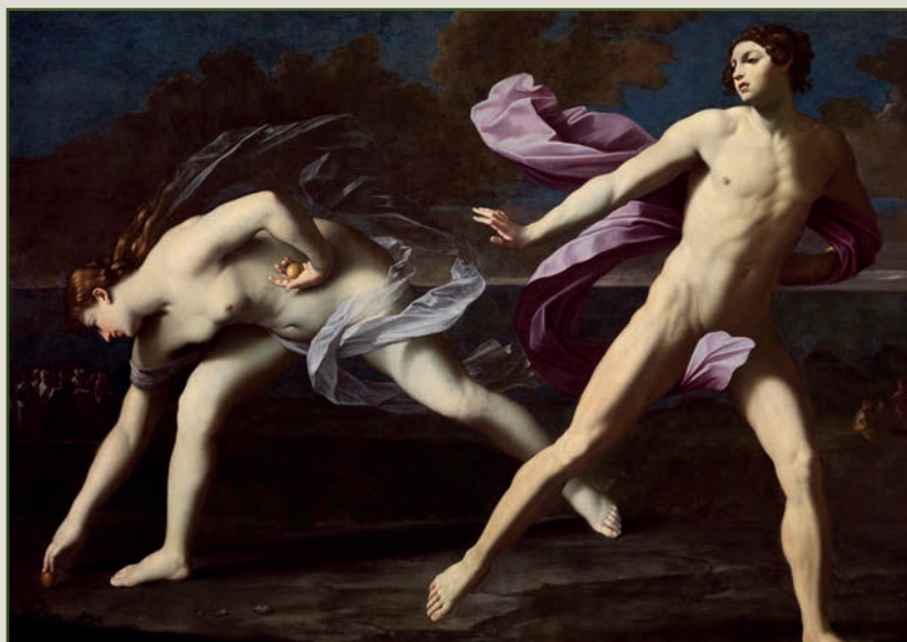
Guido Reni (Bologna, 1575-1642) Atalanta e Ippomene, 1615-1618 ca., olio su tela

Un percorso espositivo imperdibile alla scoperta di una collezione straordinaria, ma anche di una storia affascinante: quella di una Reggia divenuta un grande Museo che, nel corso dei secoli, ha preservato alcune tra le più raffinate raccolte d'arte di tutta Europa.