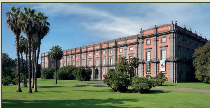
Il Palazzo Reale di Capodimonte

La mostra allestita alla Reggia di Venaria si propone di raccontare una storia straordinaria che inizia con un giovane sovrano, Carlo di Borbone, alla conquista del trono del Regno di Napoli, appena due anni dopo essere entrato in possesso - nel 1732 - del Ducato di Parma e Piacenza, favorito dalla madre Elisabetta Farnese regina di Spagna.